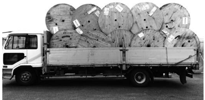
電線ドラムのリサイクルも行っております

や電設工業展等、多くの展示会に出展し、海光電業のSDGsの取り組みをPRしています。 また、ISOも継続して取り組んでいます。取得から20年経ちますが、審査機関からはいつもお褒めの言葉を頂いており、今後は、ISOとSDGsを絡めた活動を行っていきたくと思っています。 事務局 社外にPRする事で、多くの方にSDGsの影響を与え、広がっていくと感じました。